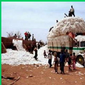
Un camion de coton détourné dans le nord du Cameroun

Dans son message à la Nation le 31 décembre dernier, le président Paul Biya constate que les efforts du Cameroun, aussi louables soient-ils, ne suffiront pas, à leur rythme actuel, pour qu'il devienne un pays émergent en 2035.