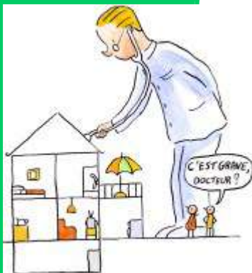
Le Médecin du bâtiment, l'expert en génie civil.

« L'humidité est un fléau, d'autant plus dangereux qu'il se propage de manière sournoise, sans qu'on y prenne garde. »