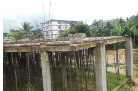
Une vue de la dalle