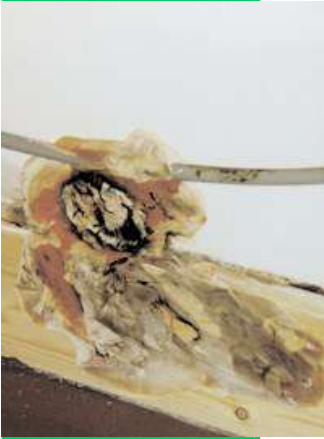
Champignon rouille à bords blancs, sur une plinthe en bois et sur une maçonnerie.

SOUVENT NÉGLIGÉS, LES PROBLÈMES D'HUMIDITÉ SONT DE VÉRITABLES DANGER POUR LA SANTÉ