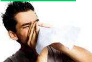
Effets de la Rhinite

L'allergie respiratoire désigne la sensibilité de certaines personnes pour les substances allergènes : les mycotoxines et les spores produits par les moisissures, les allergènes contenus dans les déjections des acariens, les émissions toxiques causées par la dégradation chimique de certains matériaux de construction attaqués par l'humidité, etc. Un Français sur cinq est atteint d'allergie et une fois sur deux, elle est respiratoire. La réaction allergène se traduit par une rhinite (écoulement nasal, nez bouché, éternuements, conjonctivite), ou bien par une toux qui signale l'apparition de l'asthme.