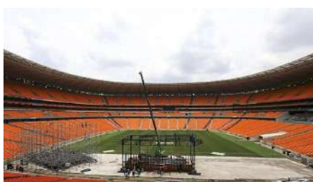
Le Orlando Stadium, installation de la tribune, pour l'hommage à Nelson Mandela