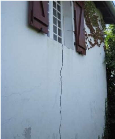
Fissures suite à l'instabilité du sol, objet d'expertise immobilière (malfaçons)

marque. Ces odeurs sont bien vite suivies de taches brunâtres sur les murs, le plafond, témoins du développement de moisissures et de micro-organismes allergènes, voire pathogènes. Ces désordres doivent être pris au sérieux, car ils menacent gravement, au terme d'une évolution parfois longue, à la fois la santé des personnes (et des enfants en particulier, dont le développement pulmonaire peut être irrémédiablement compromis, au terme d'allergies et d'affections respiratoires à répétition) et les structures bois (planchers et charpentes) parfois littéralement dévorées par l'humidité. Seul un expert immobilier indépendant est alors susceptible d'éclairer les enjeux véritables, l'origine de l'humidité, les remèdes permettant de l'éradiquer durablement et leur coût estimatif.